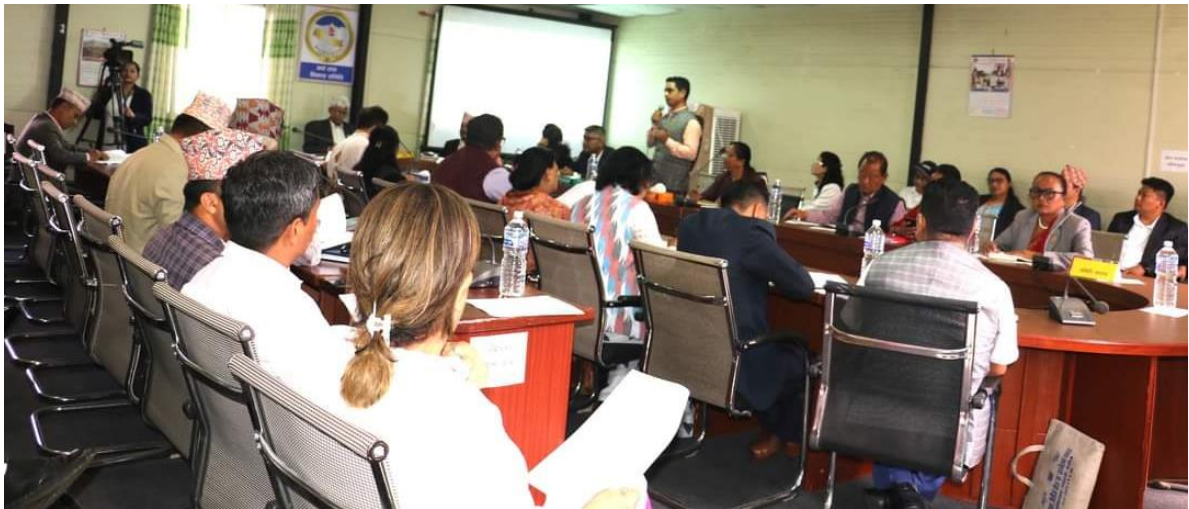
समितिको बैठकमा सरोकारवालाहरूसँग छलफल हुँदै