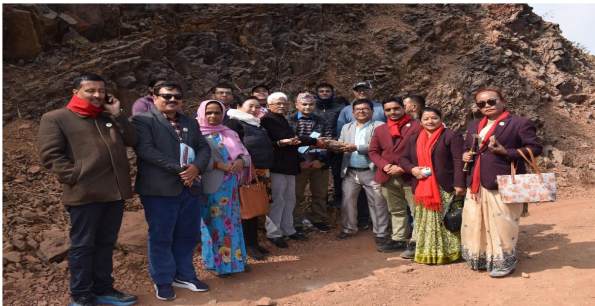
धौवादी फलाम खानी क्षेत्रको अवलोकन र अन्तरक्रिया पश्चात सामूहिक तस्विर