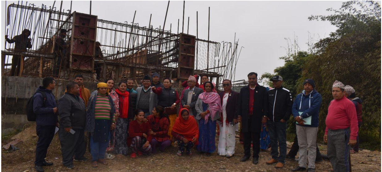
निर्माणाधिन सल्लो फुर्सोघाट मोटेरेवल पुलको निरीक्षण पश्चात