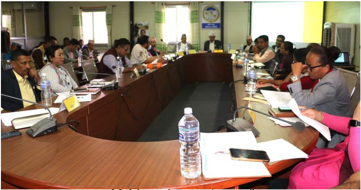
समितिको बैठकमा सरोकारवालाहरूसँग छलफल हुँदै