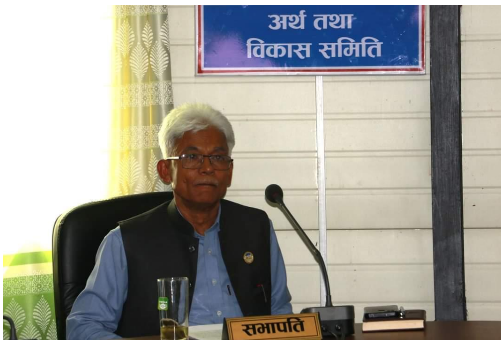
समितिको बैठकको अध्यक्षता गर्दै समितिका माननीय सभापति