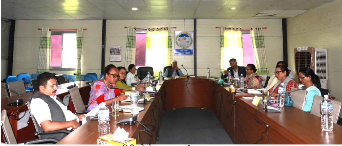
समितिको बैठकमा माननीय सदस्यहरु