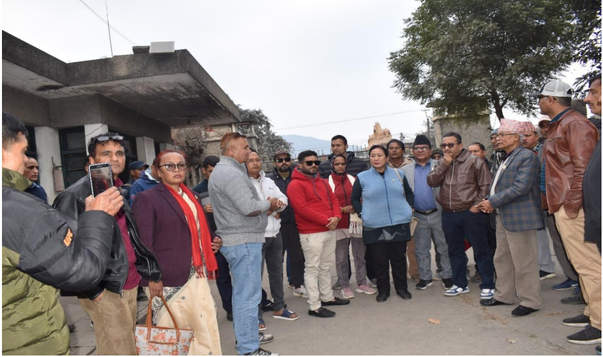
भृकुटी कागज कारखाना अवलोकनको क्रममा सरोकारवालाहरूसँग छलफल तथा अन्तरक्रिया गर्दै